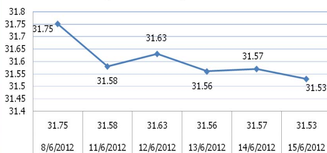
USD/THB Weekly Movement

คาดการณ์ ค่าเงินบาทระยะสั้นยังมีความผันผวนสูง จากสถานการณ์ความไม่แน่นอนในยุโรป ประเมินกรอบการเคลื่อนไหว 31.40-31.70