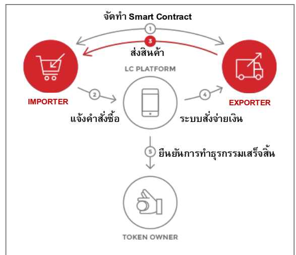
ที่มา : LC Lite

รวมถึงธนาคารพาณิชย์ของไทยที่นำ Corda มาใช้พัฒนาบริการธุรกรรมการค้าระหว่างประเทศ เช่น การเพิ่มประสิทธิภาพและลดขั้นตอนต่างๆ ของบริการ L/C ด้วยบล็อกเชน ตั้งแต่การขอเปิด L/C จนถึงผู้ส่งออกได้รับชำระค่าสินค้า ช่วยลดระยะเวลาดำเนินการและการใช้เอกสารลงกว่าครึ่งหนึ่งจาก L/C แบบเดิม ขณะที่บริษัท IBM มีบริการ IBM Blockchain เป็นการนำเทคโนโลยีบล็อกเชนเข้ามาบริหารจัดการ Trade Finance แบบครบวงจรตั้งแต่จับคู่ธุรกิจ การร่างสัญญาซื้อขาย ไปจนถึงกระบวนการชำระค่าสินค้า โดย IBM Blockchain จะช่วยลดขั้นตอนการชำระเงินระหว่างประเทศ รวมถึงแก้ไขอุปสรรคด้านความแตกต่างของสกุลเงินได้ด้วย นอกจากนี้ บริษัท LcLite เปิดตัวบริการ LC Platform Blockchain Solution ที่สามารถเชื่อมโยงผู้ที่อยู่ในวงจรการค้าทั้งหมดโดยตรง เพื่อจัดการธุรกรรม Trade Finance ด้วยสัญญาอัจฉริยะ (Smart Contract) ที่บันทึกข้อตกลงสัญญาในระบบดิจิทัลและดำเนินการเองอัตโนมัติ