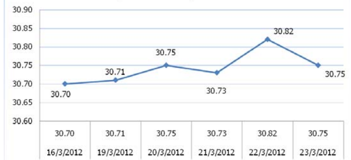
USD/THB Weekly Movement